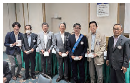
■ 8月の誕生日 宮本親睦活動委員

短い時間ですが楽しんでいただけることを念じ、例会冒頭の会長挨拶とさせていただきます。