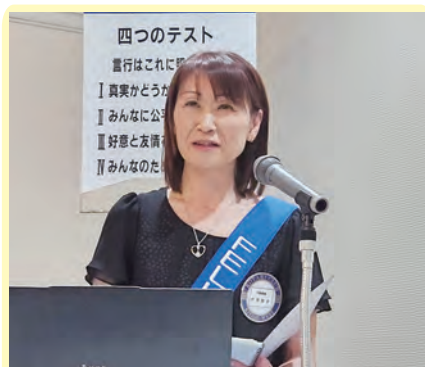
伊澤会員より「自己紹介」と題し、卓話をしていただきました。