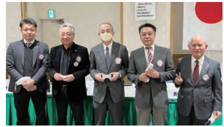
■ 3月の誕生日 石田親睦活動委員